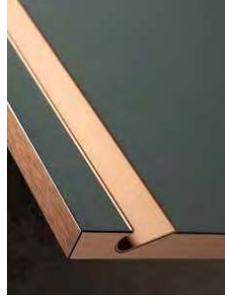
_BEA-COBRE Pos 3