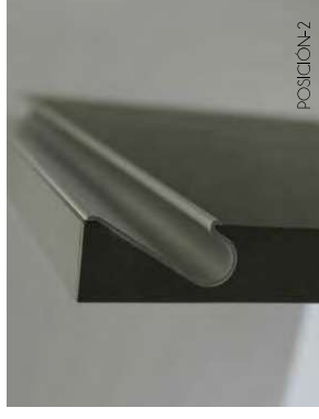
— TIRADOR BEA

— La tecnología aplicada al diseño nos permite crear un tirador 45° en dos planos, siempre utilizando cola PUR.